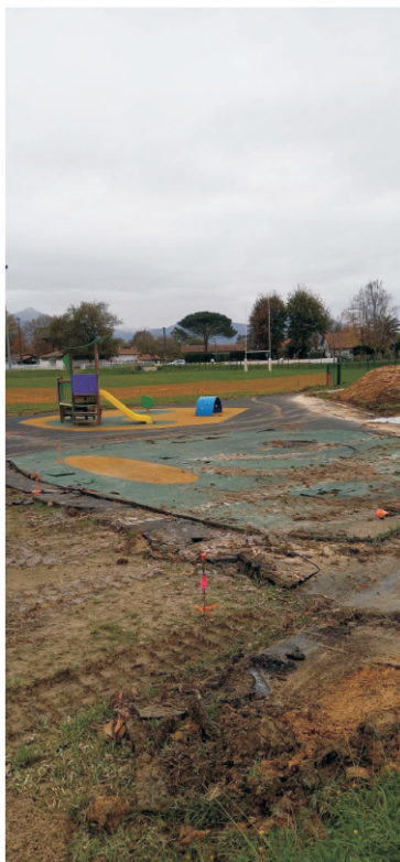
Photo de l'avancement des travaux

Pelerenia eta Gutibaratzea inguruko oinezko ibilbideen eta josta guneen antolaketen barne, obrak hasi dira. Pelereneko gela ez da elkarteentzat eta partikularrentzat alokatua izanen obren denboran (ekainaren hondarra arte) eta obren denboran jostalekua hetsia izanen da.