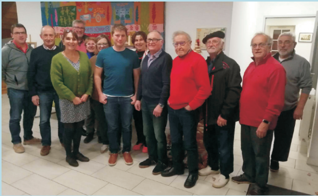
Assemblée Générale de constitution de l'association L'outil en Main Errobi

Les bénévoles, anciens professionnels ou passionnés, retraités ou non, se retrouvent au sein de l'atelier L'Outil en Main afin d'échanger et de transmettre leurs savoir-faire aux jeunes. Ces jeunes confectionnent des objets avec de vrais outils, apprennent à réparer, à concevoir. Ils découvrent alors la matière, développent leur dextérité et leur minutie, tout cela de manière ludique.